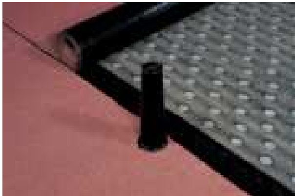
Przykład montażu kominka wentylacyjnego na papie perforowanej o śr 75 mm i wys. 30- cm